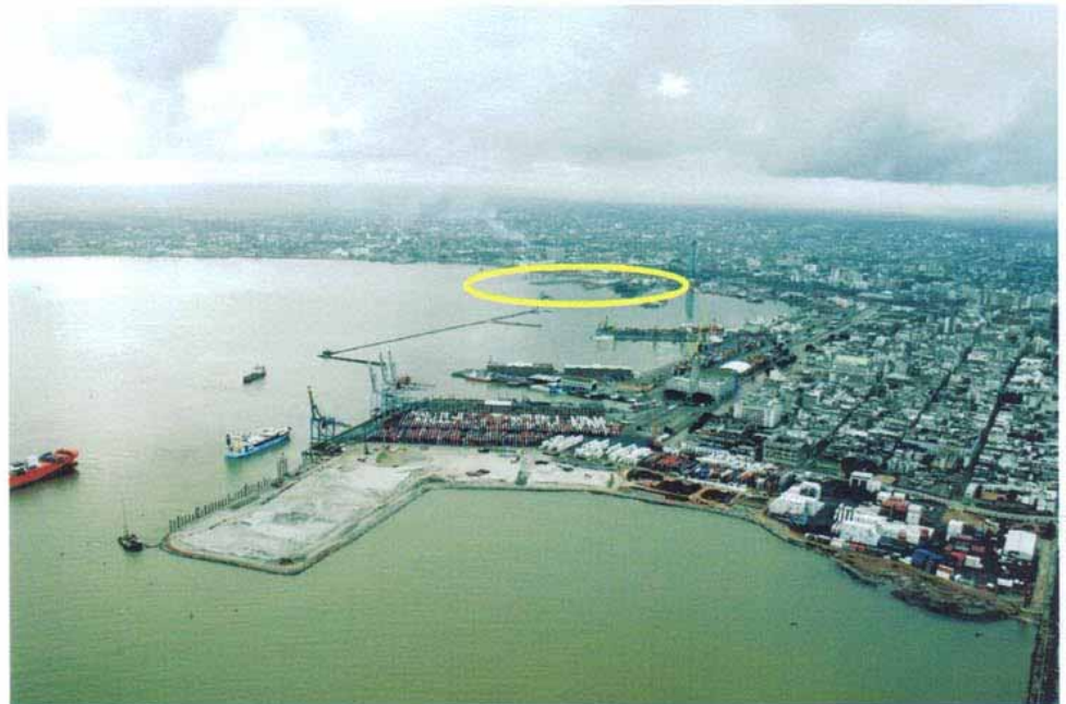
Ubicación de la Obra con respecto al Recinto Portuario Puerto de Montevideo