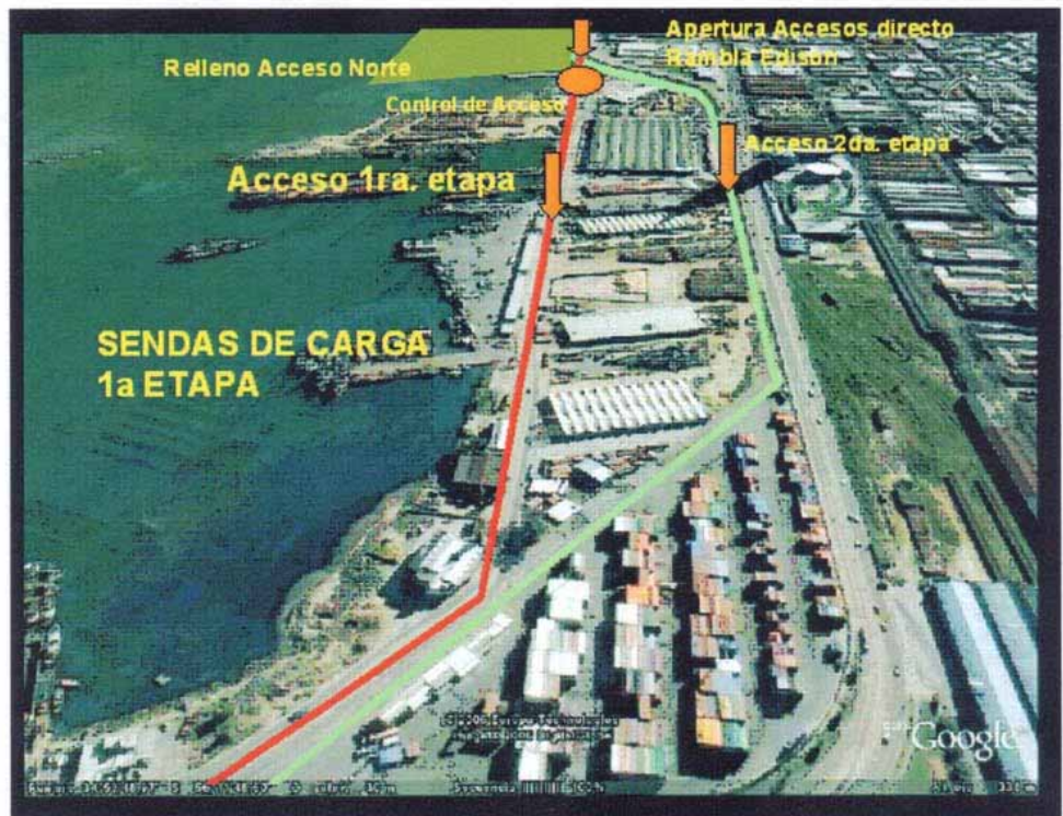
ACCESO NORTE / Sendas de Carga primera etapa