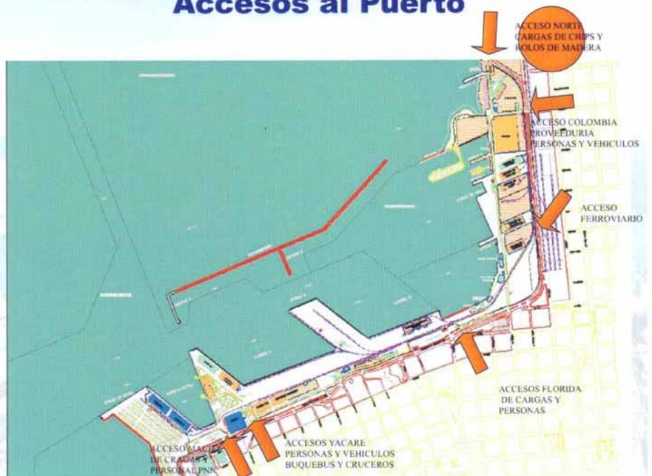
Ubicación de la Obra con respecto a los actuales accesos Puerto de Montevideo