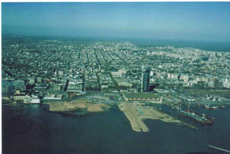
Ubicación del área de Obras / Acceso Norte Puerto de Montevideo