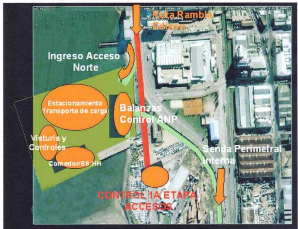
ACCESO NORTE / Detalle de áreas