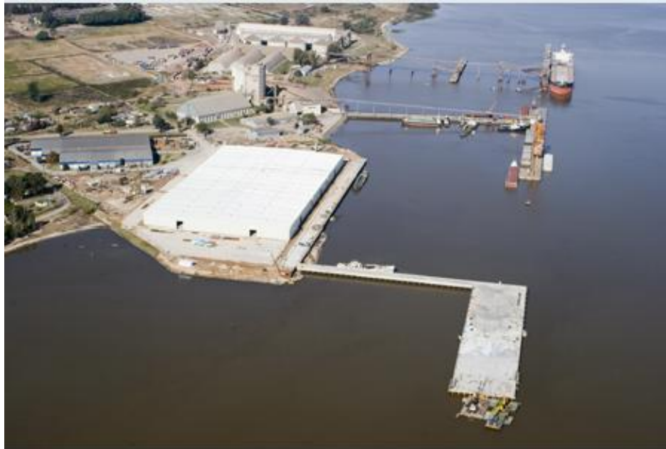
IMAGEN DEL PUERTO DE NUEVA PALMIRA