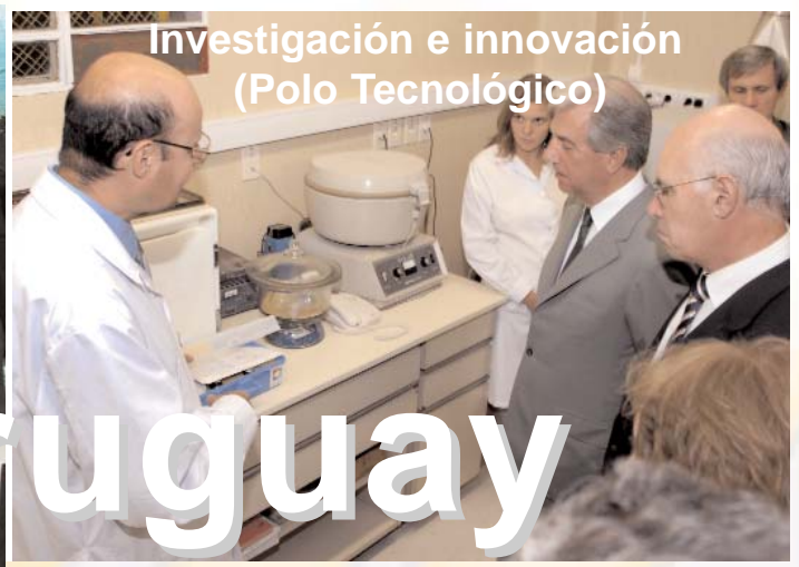
Investigación e innovación (Polo Tecnológico)