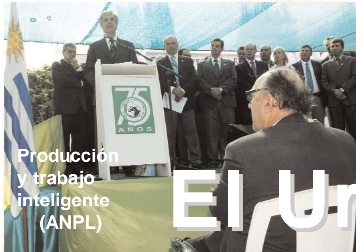
Producción y trabajo inteligente (ANPL)