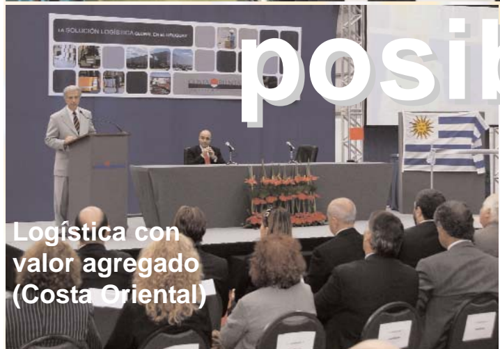
Logística con valor agregado (Costa Oriental)