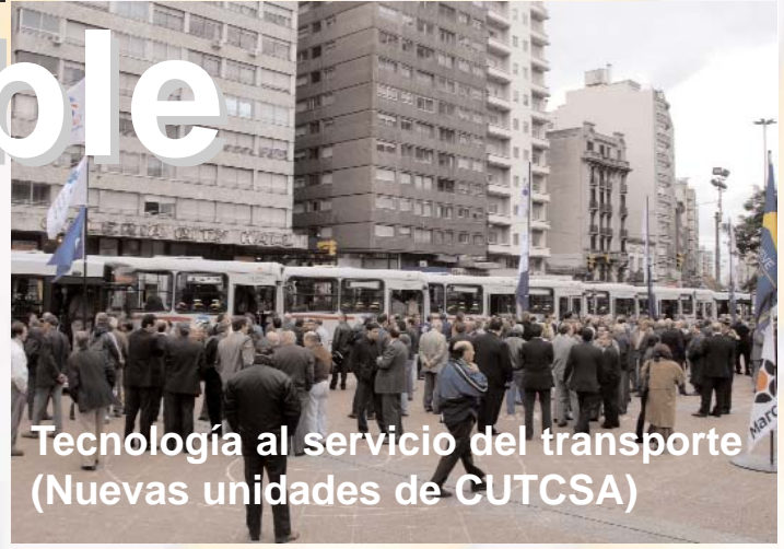
Tecnología al servicio del transporte (Nuevas unidades de CUTCSA)