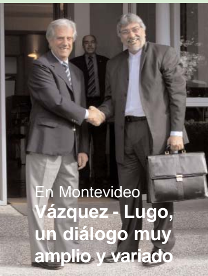
En Montevideo Vázquez - Lugo, un diálogo muy amplio y variado

El Presidente de la República, Tabaré Vázquez, recibió en su despacho de la residencia de Suárez al Presidente electo de la República del Paraguay, Fernando Lugo, quien posteriormente en conferencia de prensa informó que en el encuentro se abordaron temas tales como el intercambio comercial, la posibilidad de descubrir nuevos mercados para ambos países, así como acerca de la relación con Estados Unidos y con China Continental. Lugo dijo que también se hicieron consideraciones acerca de acrecentar el intercambio comercial entre ambos países. Lugo dijo que el tema energético estuvo presente no solo a nivel del MERCOSUR sino en América y en el planeta todo.