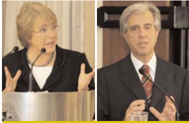
Visita de Estado a Uruguay de la Presidenta de la República de Chile, Michelle Bachelet