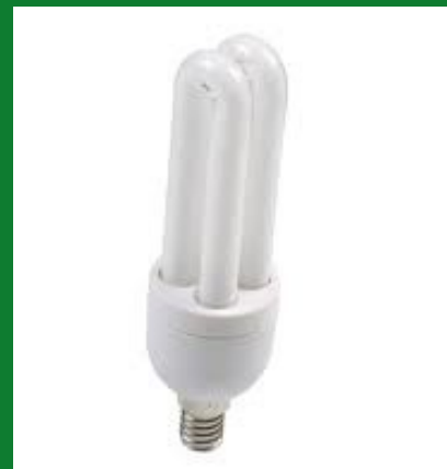
PLANTA DE ENERGÍA