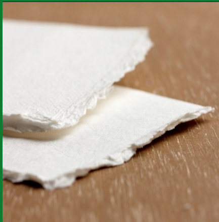
PLANTA DE CELULOSA