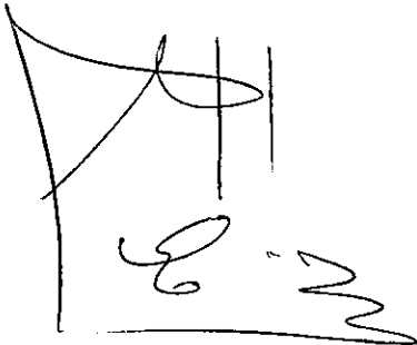
LUIS ROSADILLA Ministro de Defensa Nacional

A handwritten signature in dark ink, appearing to read 'Luis Rosadilla'.