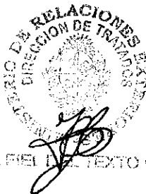
Por el Gobierno de la República de Armenia